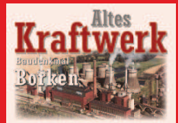
Eine Keimzelle der e-on